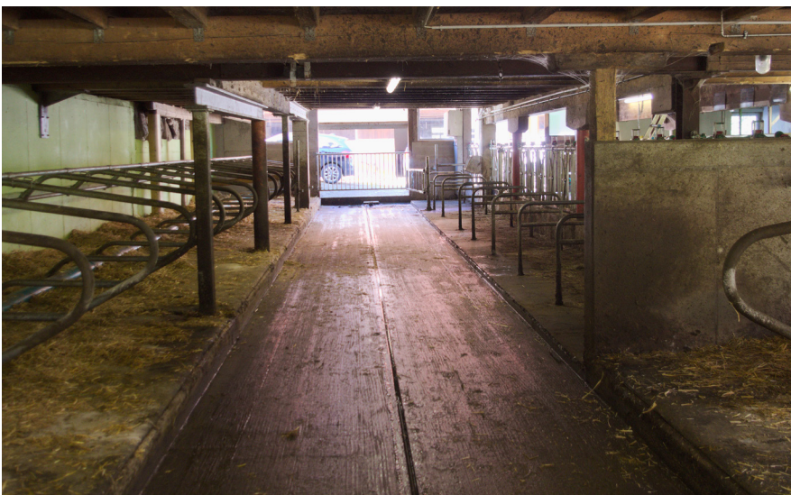
Bild 3: Kleine Umbaulösung in einem Schwarzwaldhof