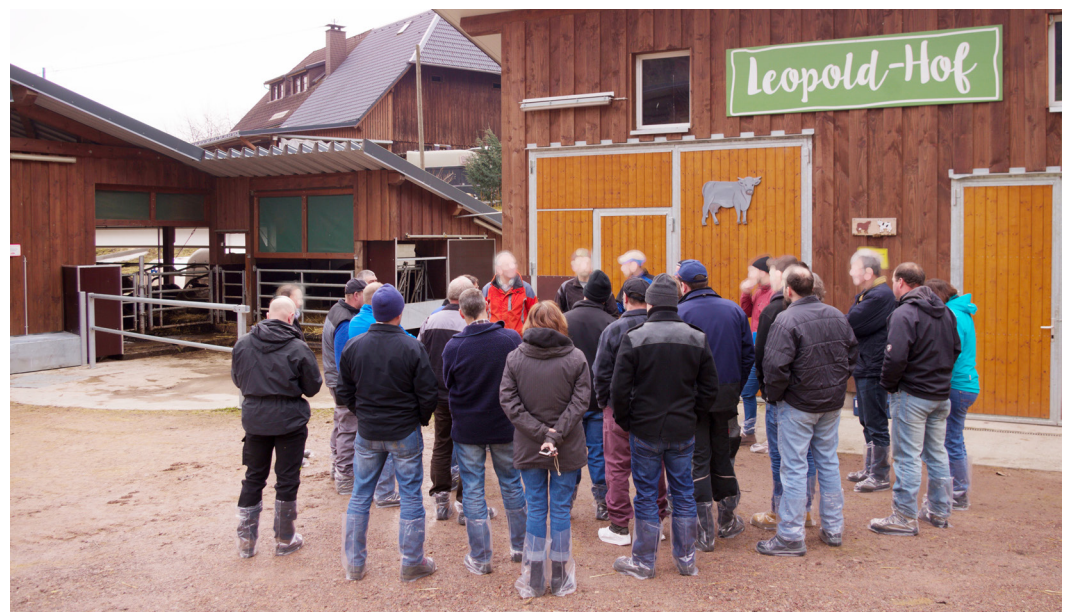
Bild 3: Gruppenberatung mit Stallbauexkursion

ge gehalten, Fortbildungen und Lehrfahrten organisiert und durchgeführt. Sie steht auch für fachliche Rückfragen der Unteren Landwirtschaftsbehörden und des Regierungspräsidiums zur Verfügung und gibt auch Stellungnahmen zur tiergerechten Haltung im Rahmen der Förderverfahren ab.