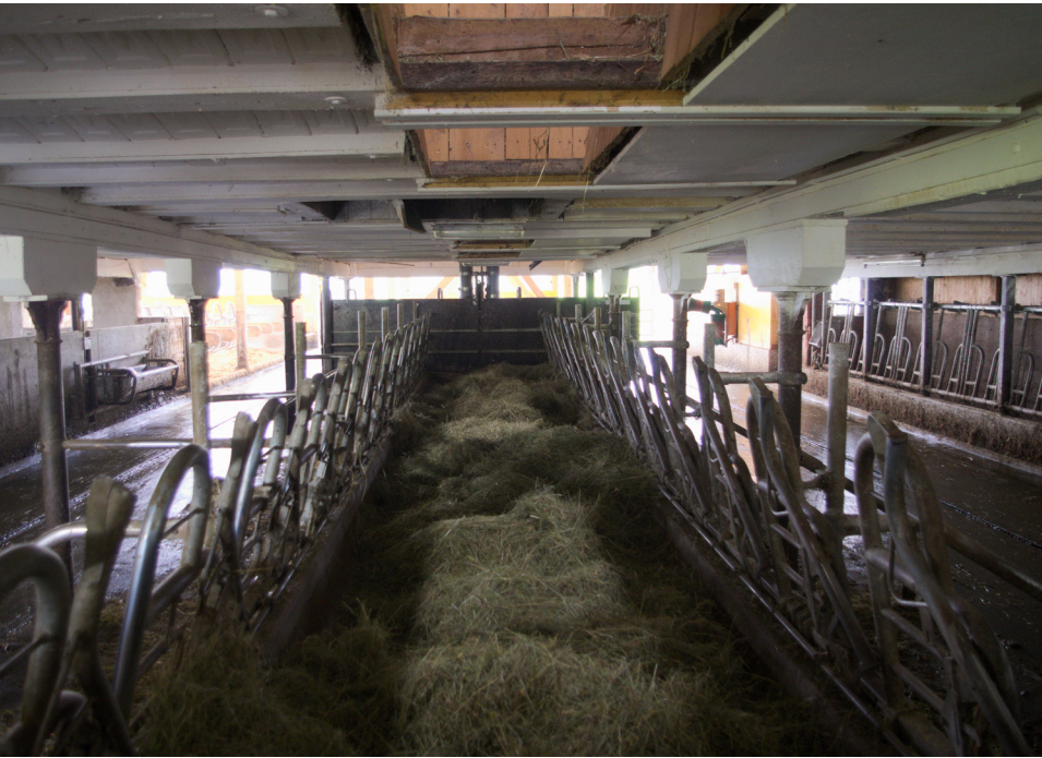
Bild 2: Innenumbau in einem Schwarzwaldhof mit schmalen Futtertisch, der von oben befüllt wird

erhält der Landwirt eine detaillierte Skizze des geplanten Vorhabens, die dann als Basis für die weitere Fachplanung durch den Planer oder Architekten steht. Die Bauberatung ist damit die Schnittstelle zwischen Bauherr (Landwirt) und der Fachplanung (Planer/Architekt) und übersetzt die Wünsche und Ideen des Bauherrn unter Berücksichtigung fachlicher, baurechtlicher und förderrelevanter Belange in eine Planungsgrundlage für Planer und Architekten.